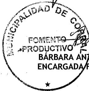
BÁRBARA ANTILLANCA VILLALONCO ENCARGADA FOMENTO PRODUCTIVO